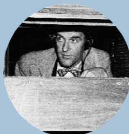
Forum de dialogue mondial