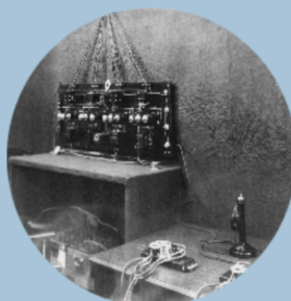
Fonctionnement de l'OIT