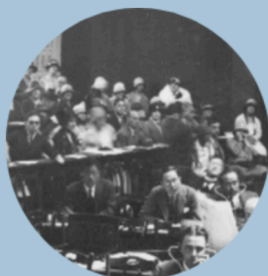
Histoire de l'OIT

Cliquez sur le volet théorique de votre choix pour en savoir plus. Vous pouvez revenir à ce menu à tout moment depuis la table des matières en cliquant sur les flèches >> en haut à gauche ou sur le bouton TOC dans la barre de navigation.